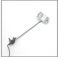
B 03 Langarmstrahler