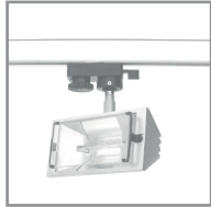
B 01 Halogenstrahler

INTERDIVE Friedrichshafen 25.-28.09.2025