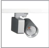
B 02 LED-Strahler