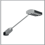
B 04 LED- Langarmstrahler