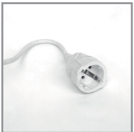
B 08 Steckdose