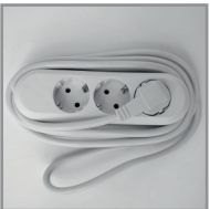
B 09 Dreifachsteckdose