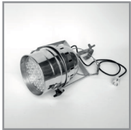
B 05 LED- Bühnenscheinwerfer