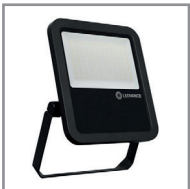
B 07 LED-Floodlicht