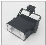
B 06 HQI-Strahler